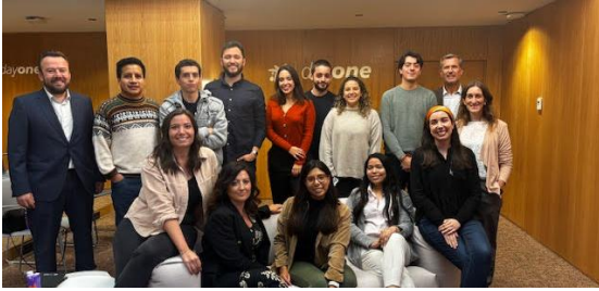
Imagen: encuentro Caixa (4ª Ed.)