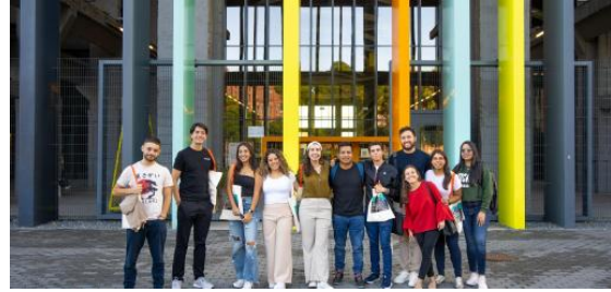
Imagen: encuentro La Nave (4ª Ed.)