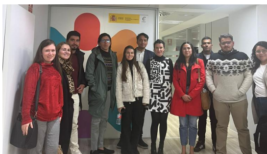
Imagen: encuentro ENISA (3ª Ed.)