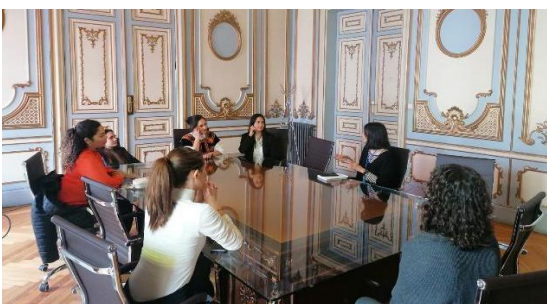
Imagen: encuentro CSIC (1ª Ed)

Se reservará una jornada a la semana para que los participantes puedan gestionar sus agendas particulares, lo que también podrán hacer en los tiempos libres.