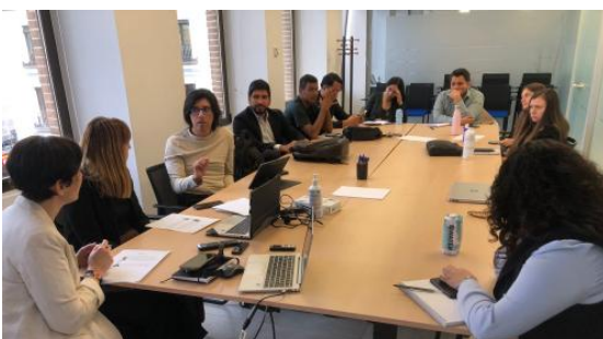
Imagen: encuentro MIA (3ª Ed.)