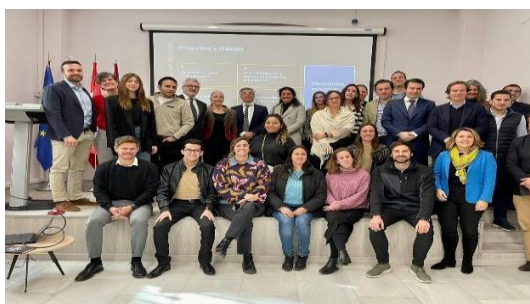
Imagen: recepción del BID en International Lab (1ª Ed)