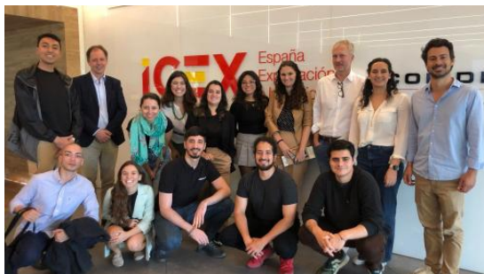
Imagen: encuentro ICEX (2ª Ed.)