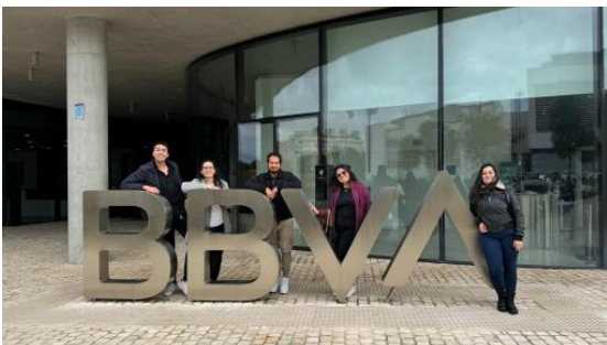
Imagen: encuentro BBVA (2ª Ed.)